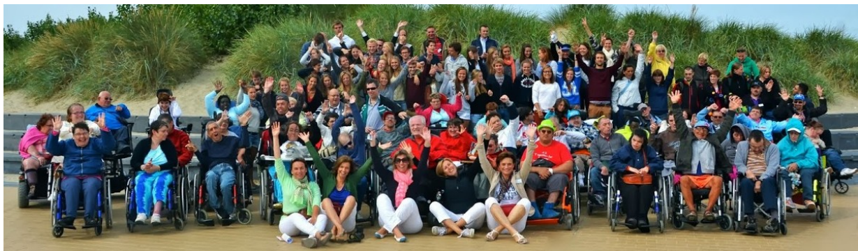
Camp de Ter Helme 2013