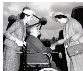
25ème anniversaire de l'ABP en 1963, en présence de la reine Fabiola

L'assistance matérielle : distribution de dons en cas d'absolue nécessité, prêt/location de matériels tels que voitures, cannes, béquilles, fauteuils.