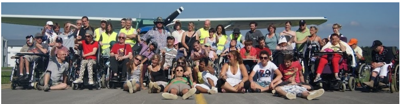
Camp de Marbehan 2012