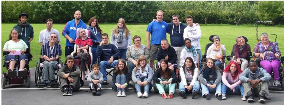
Camp de Ciney 2013

Voir et revoir les photos des camps de vacances sur le site www.abpasbl.be rubrique Camps de vacances et sur les sites des camps.