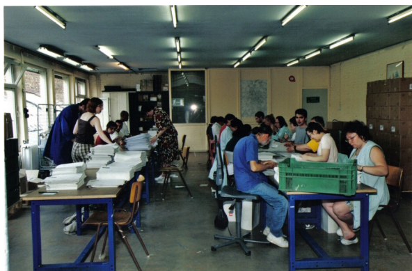
Atelier rue Charles Demeer

Tout d'abord une remarquable motivation des travailleurs handicapés du fait que, malgré leur handicap, ils ont les capacités de gagner leur vie et, dès lors, d'être totalement intégrés dans la société.