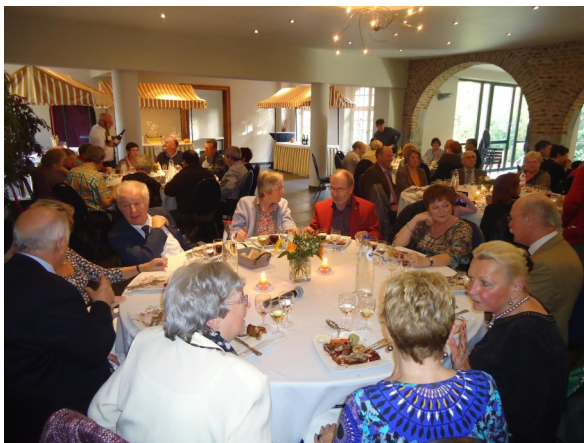
Banquet Annuel de la Section Polio

Fondée en 2005, l'Association Francophone Polio et Post Polio (AFPPP) contacta 7 ans plus tard l'ABP pour demander une aide logistique et administrative dans le cadre de sa mission. Très rapidement, ce partenariat évolua et les associations décidèrent de fusionner. Une nouvelle section vit ainsi le jour en