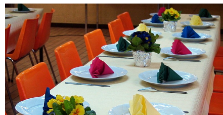
Les activités et les responsables bénévoles de l'ABP-Rixensart